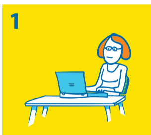
1 Via Kindpakket.nl vraagt u een vergoeding aan

Kijk voor alle mogelijkheden op www.gemeentealtena.nl/kindpakket of www.kindpakket.nl . Na uw aanvraag nemen vrijwilligers van Stichting Leergeld WBO contact met u op om uw aanvraag door te spreken. Wilt u meer weten over de stichting, kijk dan op www.leergeldwbo.nl .