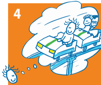
4 Als de aanvraag is goedgekeurd, zorgen wij voor betaling: uw kind kan meedoen!