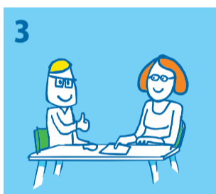
3 Een vrijwilliger van Kindpakket.nl komt bij u thuis om de aanvraag door te nemen