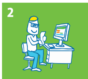
2 Kindpakket.nl behandelt de aanvraag