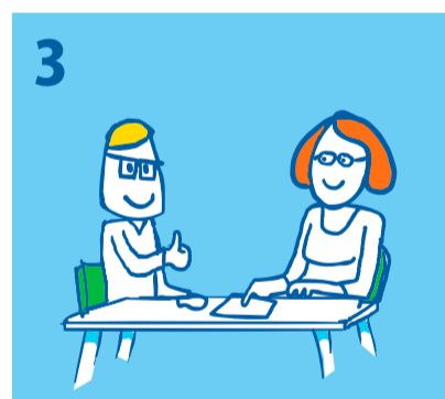
3 Een vrijwilliger van Kindpakket.nl komt bij u thuis om de aanvraag door te nemen