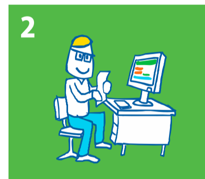
2 Kindpakket.nl behandelt de aanvraag