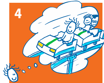
4 Als de aanvraag is goedgekeurd, zorgen wij voor betaling: uw kind kan meedoen!