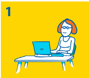
1 Via Kindpakket.nl vraagt u een vergoeding aan

Kijk voor alle mogelijkheden op www.gemeentealtena.nl/kindpakket of www.kindpakket.nl . Na uw aanvraag nemen vrijwilligers van Stichting Leergeld WBO contact met u op om uw aanvraag door te spreken. Wilt u meer weten over de stichting, kijk dan op www.leergeldwbo.nl .