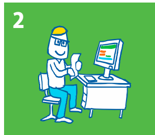
2 Kindpakket.nl behandelt de aanvraag