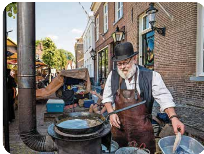
Visbakken Woudrichem

de herfst. In de zomer van 2020 konden wel kleinschalige evenementen plaatsvinden, maar in aangepaste vorm. Er kwam veel creativiteit los bij het omgaan met de coronarichtlijnen, vanuit de gedachte wat er nog wel mogelijk was. Bijzonder om dat te merken! Het is heel fijn om te ervaren dat het contact met organisaties over en weer goed is. Het geeft me veel energie en voldoening wanneer je met elkaar dan toch voor de inwoners van Altena een evenement kan organiseren. Zo kunnen we ook in deze moeilijke periode voor enige ontspanning zorgen. Daar word ik helemaal blij van!”