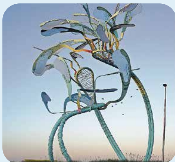
Rotonde Almkerk Kunstenaar Harmke Koning

"Cultuur is meer dan Kunst met een grote K."