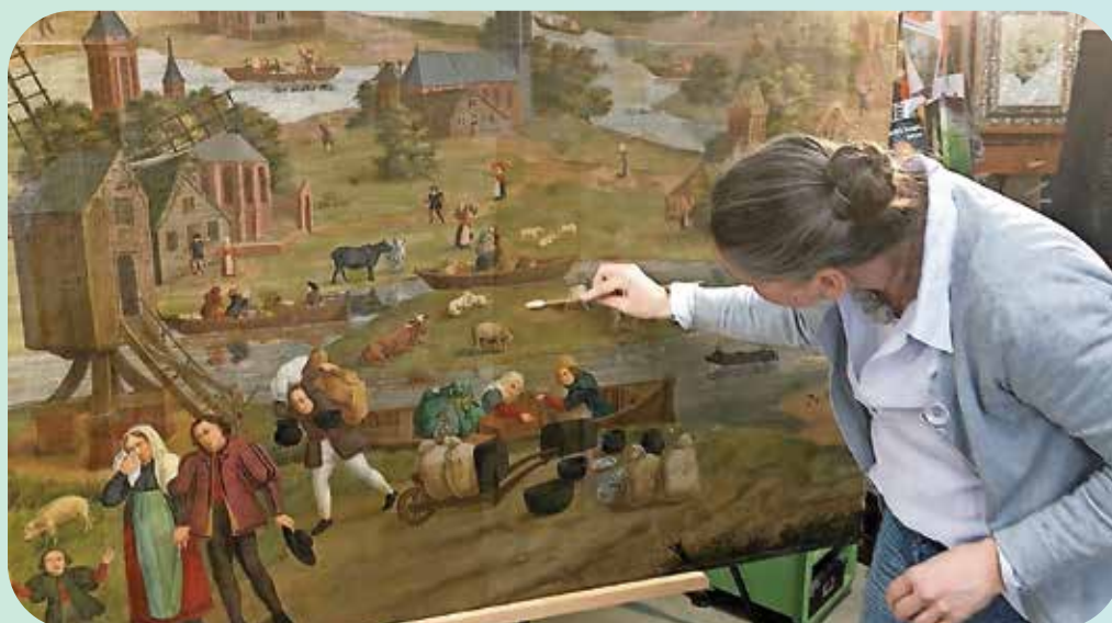
Restauratie van het schilderij Sint Elisabethsvloed van H. Weingärtner in 2017. Dit schilderij is sinds 2002 in bruikleen van het NoordBrabants Museum in Den Bosch.

Vlak voor de eerste lockdown, op 8 maart 2020, werd de installatie 'Waiting for it to end' van Palestijns-Libanese kunstenaar Alaa Minawi onthuld. Het vormde onderdeel van het programma 'Kunst van de Vrijheid'. De installatie verbeeldt twee mensen die troost zoeken bij elkaar, samen wachtend op het einde van de wreedheid van de oorlog. In 2020 waren diverse voorstellingen bij de installatie geprogrammeerd, maar deze moesten vanwege de coronapandemie worden geschrapt. Van Beek: "Die voorstellingen hebben we niet opnieuw opgezet. We merkten dat de fut er een beetje uit is rond 75 jaar bevrijding." Voor het museum is het coronajaar een hectisch jaar geweest, zo miste het museum zo'n 30.000 bezoekers. Ook de fluisterboten konden slechts op halve kracht varen vanwege halvering van het aantal passagiers door de anderhalve meter maatregelen. Tijdens de sluiting miste het museum tevens de omzet van het museum café 'Biesonder'. "We waren graag eerder open gegaan met ons terras, maar het museum is onze hoofdactiviteit, zodat de horeca niet eerder open mocht."