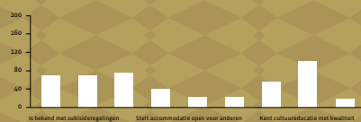
Klik hier voor de resultaten van de enquête en interviews.

Grote instellingen die de cultuur van Altena uitdragen en in stand houden zijn het Streekarchief, Erfgoed Altena, de Bibliotheek Cultuurpunt Altena, het Biesbosch Museum Eiland en de VVV Biesbosch Linie. Ze zijn door de leden van de cultuurraden geïnterviewd over het bestaande beleid, wensen en ontwikkelingen. Het behoud en uitdragen van ons erfgoed, stimuleren en faciliteren van cultuureducatie, delen van kennis en expertise en gezamenlijke communicatie en promotie zijn de gemeenschappelijke behoeften.