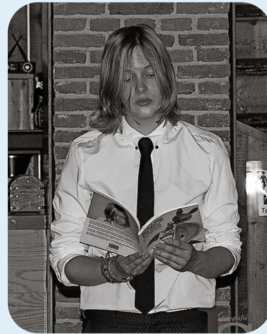
Marieke Lucas Rijnveld op Slot Loevestein