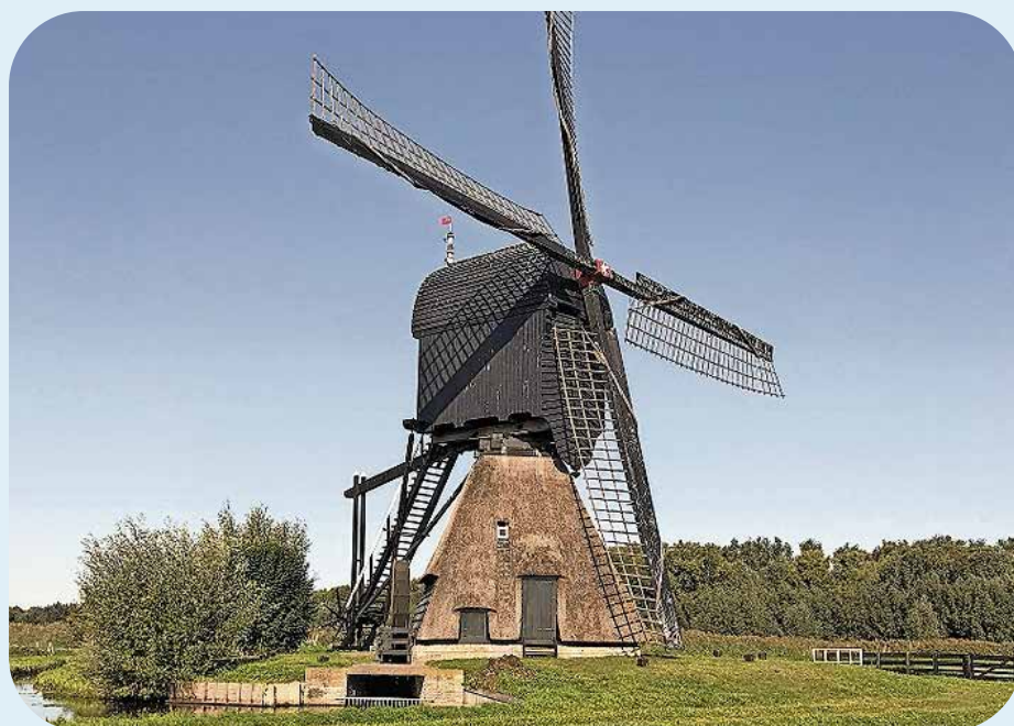
Kornse Boezem, Noordeveldse molen