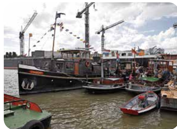
Havendagen Werkendam - Foto: WMI

Hoewel tijdens de coronapandemie evenementen tijdelijk werden verboden, beleefde ze toch een druk jaar. Vooral ook omdat de landelijke richtlijnen voor het organiseren van een evenement steeds wijzigden. Het effect ervan was vaak onduidelijk. “Bij de eerste lockdown voorjaar 2020 was er vooral schrik bij de organisatoren. Ik kreeg vaak de vraag gesteld wat die lockdown nu precies in de praktijk betekende voor het evenement dat al gepland stond. Veel evenementen werden toen verzet naar