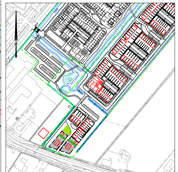
SITUATIE Schaal 1 : 5000