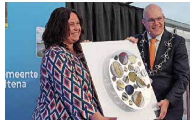
De schaal 2021 is uitgereikt aan de Hartenbrigade uit Giessen/Rijswijk

De schaal wordt uitgereikt aan een organisatie die deze waardering verdient voor hun inzet van en voor de samenleving.