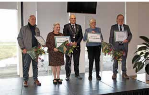
In februari kregen 10 inwoners de Parel van Altena uitgereikt. Omdat er toen coronarichtlijnen golden, staat niet iedereen op deze foto.

De parel wordt uitgereikt aan personen die een extra waardering verdienen voor hun inzet voor de samenleving.