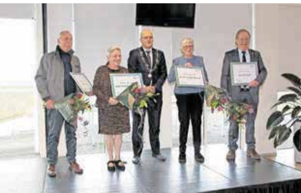
In februari kregen 10 inwoners de Parel van Altena uitgereikt. Omdat er toen coronarichtlijnen golden, staat niet iedereen op deze foto.

De parel wordt uitgereikt aan personen die een extra waardering verdienen voor hun inzet voor de samenleving.