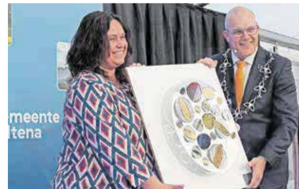
De schaal 2021 is uitgereikt aan de Hartenbrigade uit Giessen/Rijswijk

De schaal wordt uitgereikt aan een organisatie die deze waardering verdient voor hun inzet van en voor de samenleving.