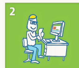
Kindpakket.nl behandelt de aanvraag