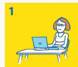
Via Kindpakket.nl vraagt u een vergoeding aan

Kijk voor alle mogelijkheden op www.kindpakket.nl . Na uw aanvraag nemen vrijwilligers van Stichting Leergeld WBO contact met u op om uw aanvraag door te spreken. Wilt u meer weten over de stichting, kijk dan op www.leergeldwbo.nl .