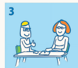
Een vrijwilliger van Kindpakket.nl komt bij u thuis om de aanvraag door te nemen