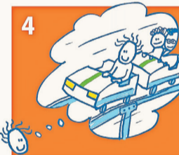
Als de aanvraag is goedgekeurd, zorgen wij voor betaling: uw kind kan meedoen!