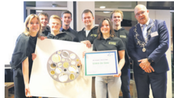
De schaal 2023 is uitgereikt aan SJWA De Soos uit Almkerk.

De schaal wordt uitgereikt aan een organisatie die deze waardering verdient voor hun inzet van de voor de samenleving.