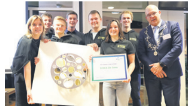
De schaal 2023 is uitgereikt aan SJWA De Soos uit Almkerk.

De schaal wordt uitgereikt aan een organisatie die deze waardering verdient voor hun inzet van de voor de samenleving.