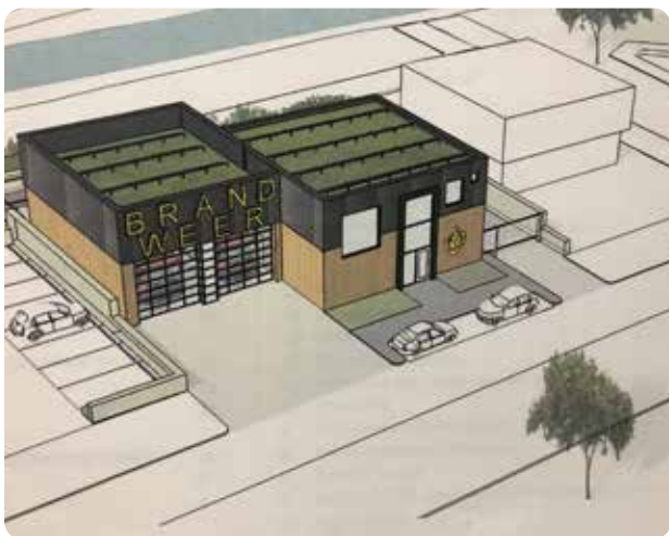
De kazerne in Almkerk wordt vervangen door een fatsoenlijk gebouw dat een goede werkbasis biedt aan de brandweerlieden.

“De mannen en vrouwen die hun leven wagen voor onze veiligheid, verdienen een degelijk onderkomen.”